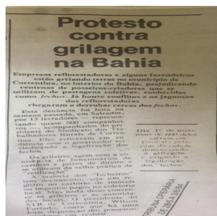
Figura 3 – Notícia do jornal “A Foice” (1985), Página 8