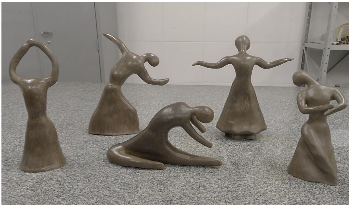
Figura 2- Roseli Almeida, Escultura, 2018