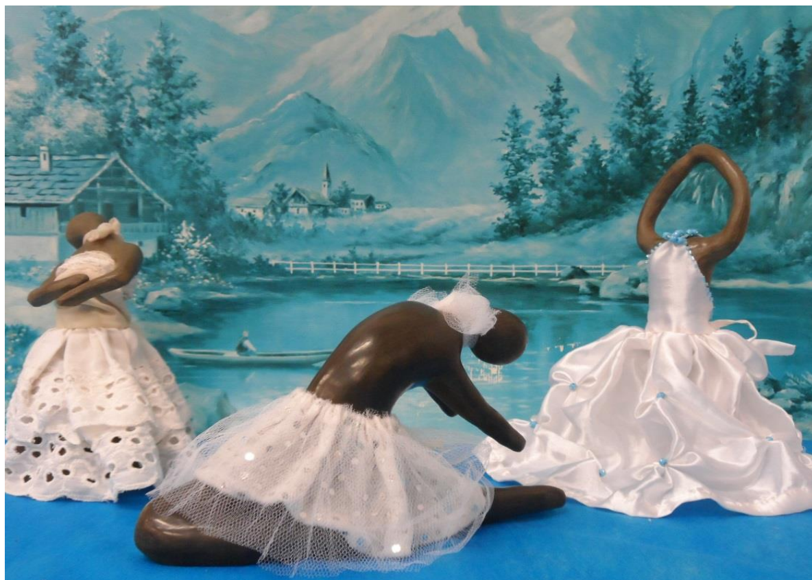
Figura 3 - Roseli Almeida, “Memórias em Movimento, 2018